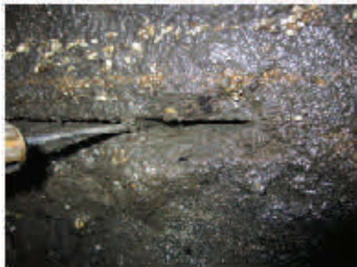
Typiskt läckage på äldre avskiljare. Gummipackningen har sedan länge vittrat sönder med in och utläckage som följd.

Besiktningen ska utföras av ett ackrediterat företag eller av företag med motsvarande kunskap.