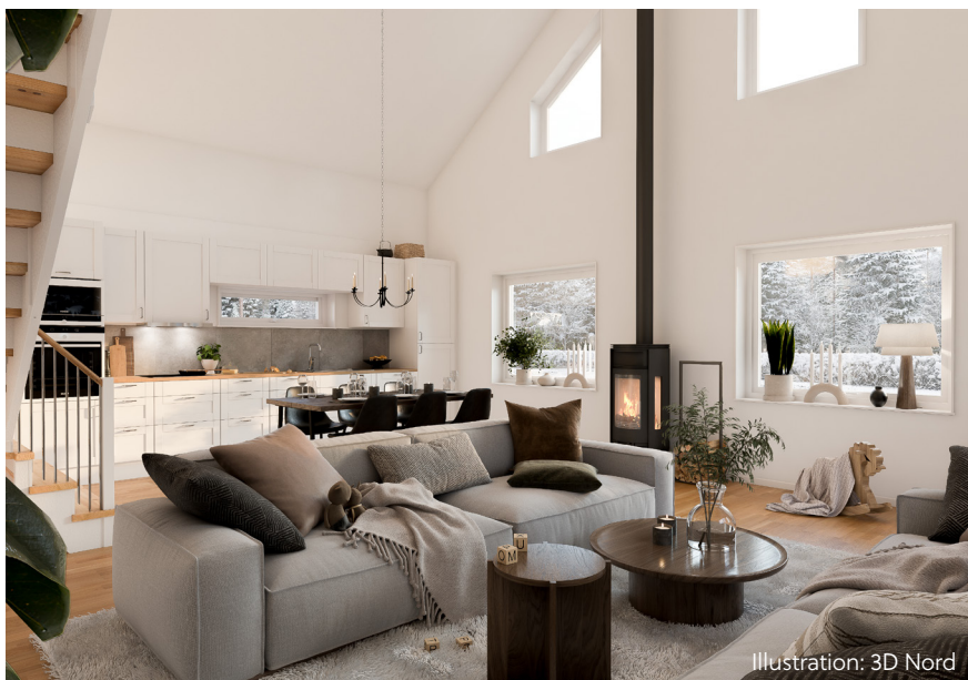
Illustration: 3D Nord

Illustration av hur du kan bo i framtiden.